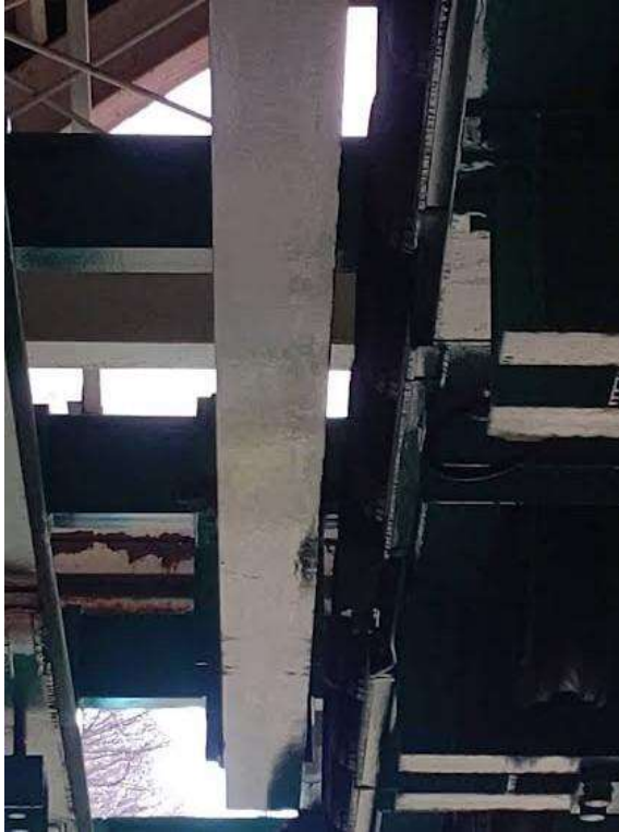
【握索部レール整備】