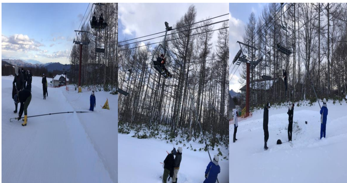
【スタッフ参加のリフト救助訓練風景】