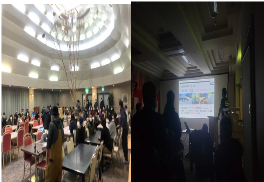
【冬期従業員の研修風景】